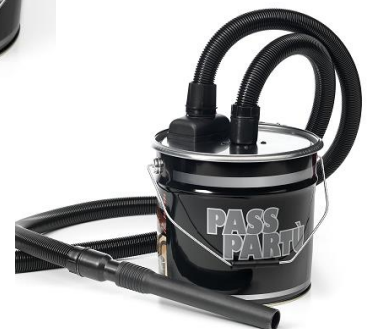
KTRI40039 – PASS PARTU

Separator voor vuilresten en vloeistoffen (met vlotter). Deze voorzetketel, die met normale stofzuigers kan worden gebruikt, bewijst zijn nut in het reinigen van schoorstenen door het gemakkelijk opzuigen van as, roet en verbrandingsresten zonder de omgeving te vervuilen. Uitgerust met patroonfilter ref. FTDP00325 -20275