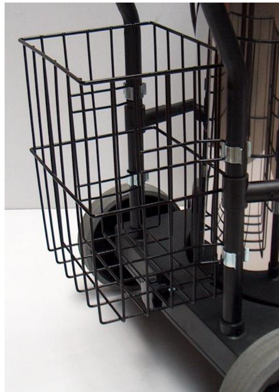
TOEBEHOREN MAND, steeds in optie REF. MPVR10391 - 00043