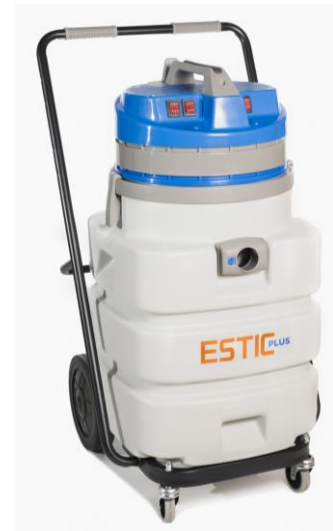
ESTIC PLUS 115 SPOT