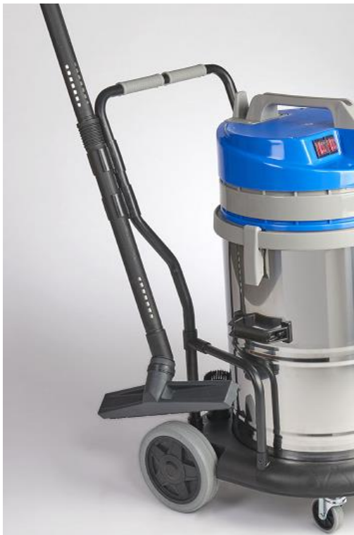
STELKLEMMEN – REF. MPVR08170