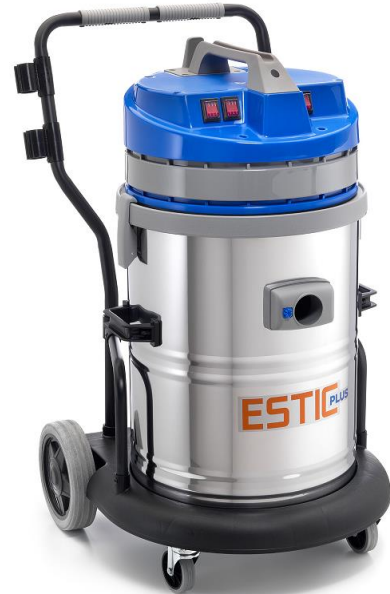
ESTIC PLUS 440 M