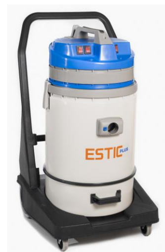
ESTIC PLUS 515 MP ESTIC PLUS 429 BP ESTIC PLUS 440 BP