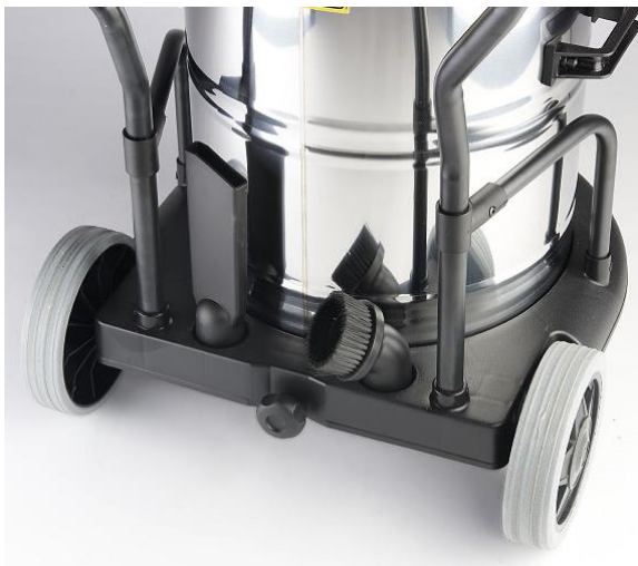
OPBERGSYSTEEM VOOR TOEBEHOREN.