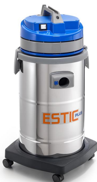
ESTIC PLUS 515