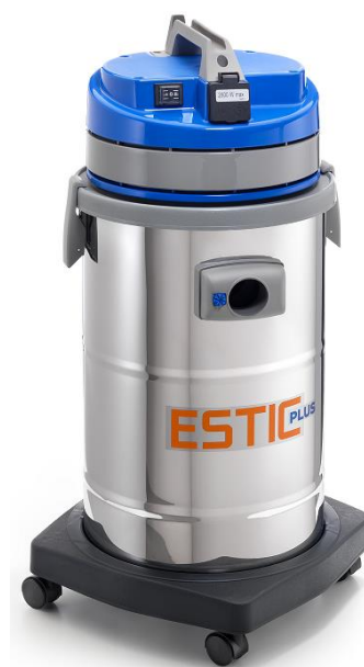
ESTIC PLUS 515 RC